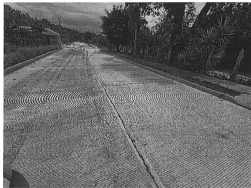
Concepto de obra ejecutado: