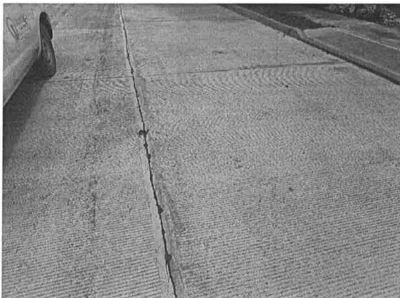
Concepto de obra ejecutado:

Municipio: TIHUATLÁN Localidad: SAN PEDRO MIAHUAPAN Ejercicio fiscal: EJERCICIO 2022 No. de obra: 2022301750503 Periodo: AGOSTO Número de estimación: Descripción: CONSTRUCCION DE PAVIMENTO HIDRAULICO EN LA CALLE JOSEFA ORTIZ DE DOMINGUEZ ENTRE LAS CALLES 16 DE SEPTIEMBRE Y AGUSTIN DE ITURBIDE DE LA LOCALIDAD DE Fuente de financiamiento: ORTAFIN 2016 (SENTENCIA) Fecha de revisión: 23/09/2022