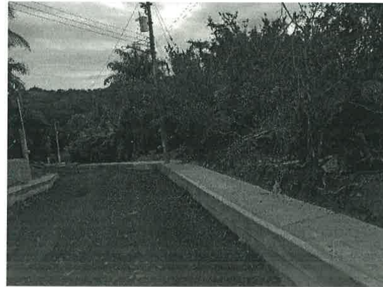
Concepto de obra ejecutado: Construcción de guarniciones y banquetas de concreto simple fc150 Kg/cm 2