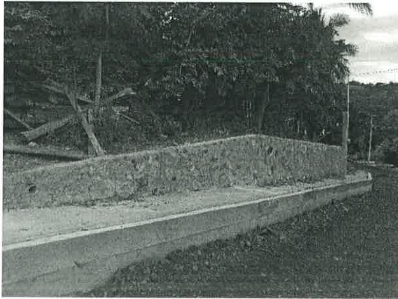
Concepto de obra ejecutado: Construcción de muro de contención a base de piedra cantera de sección 80x40

Municipio: TIHUATLÁN Localidad: EL ORIENTE Ejercicio fiscal: EJERCICIO 2022 No. de obra: 2022301750600 Periodo: SEPTIEMBRE Número de estimación: N/A Descripción: CONSTRUCCIÓN DE PAVIMENTO HIDRÁULICO EN LA CALLE BICENTENARIO ENTRE CARRETERA MEXICO - TUXPAN Y LIDERO DE LA LOCALIDAD DE EL ORIENTE, TIHUATLAN, Fuente de financiamiento: EFMPHT 2016 (SENTENCIA) Fecha de revisión: 21/10/2022